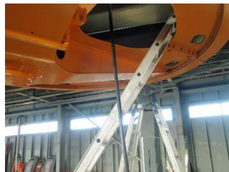
油圧緊張ユニット整備