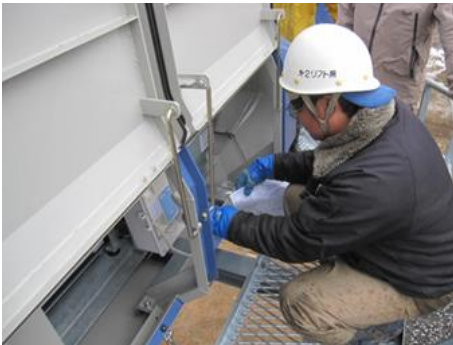
ペアリフト山麓原動設備点検