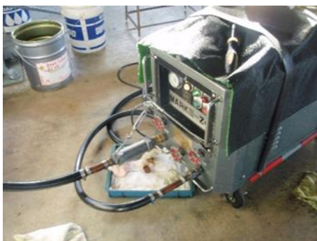
油圧緊張ユニット整備