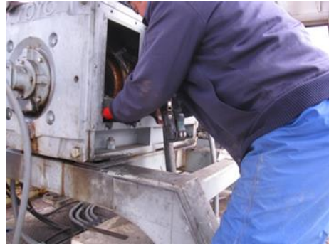
ペアリフトモーターブラシ交換