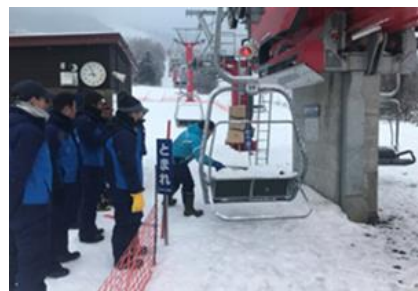
索道係員接客研修