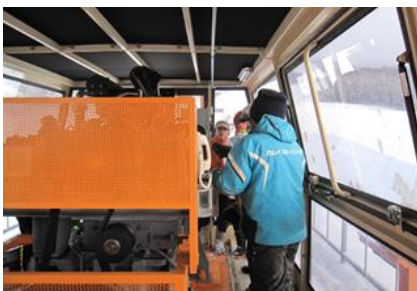
予備原動機操作方法訓練