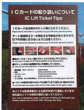
ICカードの取り扱いについて