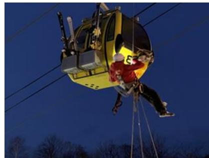
ゴンドラ救助訓練