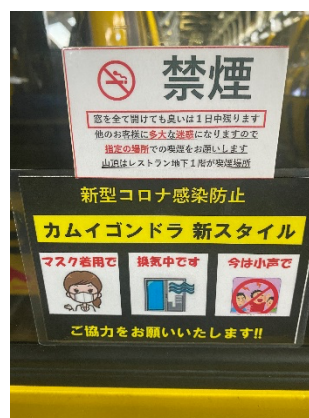
ゴンドラ搬器内掲示