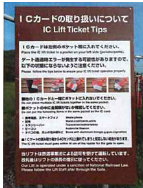
ICカードの取り扱いについて