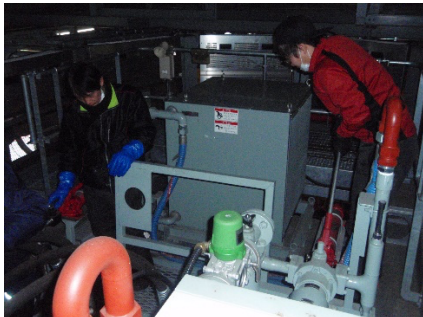
ゴンドラ予備原動機操作方法訓練