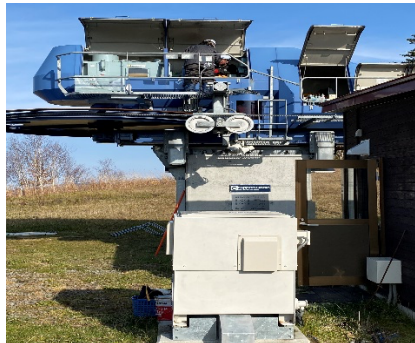
リフト予備原動機操作方法訓練