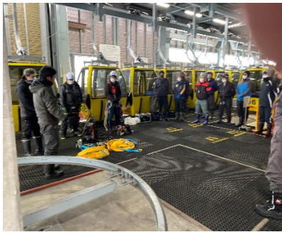
ゴンドラ救助説明