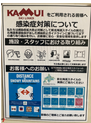
リフト、ゴンドラ乗り場掲示

ICカードの取り扱い方法やリフトの乗車、降車方法に関する注意事項を示した掲示板を設置、コロナウィルス感染拡大防止のお願い等を掲示、放送、声掛けなどで実施いたしました。