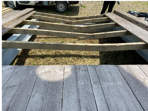
降り場ステージ整備