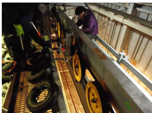
ゴンドラ押送装置点検