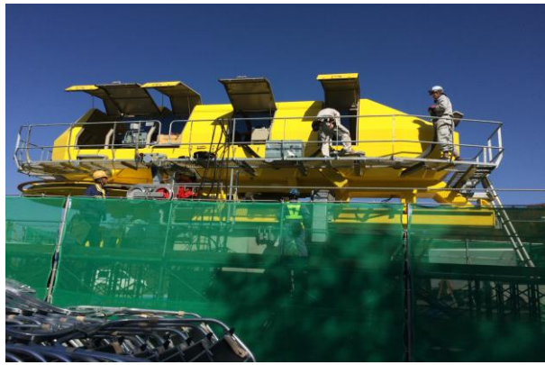
第2ペアリフト山麓原動機更新