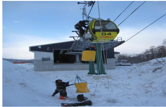
ゴンドラ救助訓練