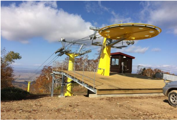
第2ペアリフト山頂停留場機械更新