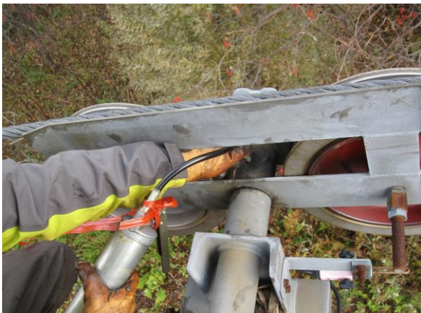
第3ペアリフト索受け装置点検・修