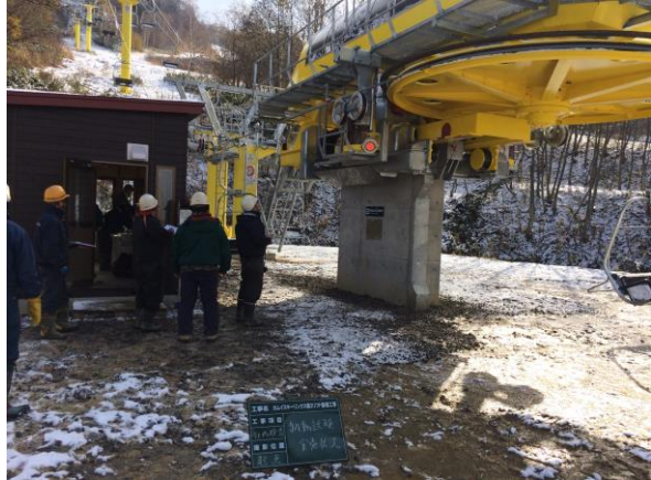
第2ペアリフト荷重試験