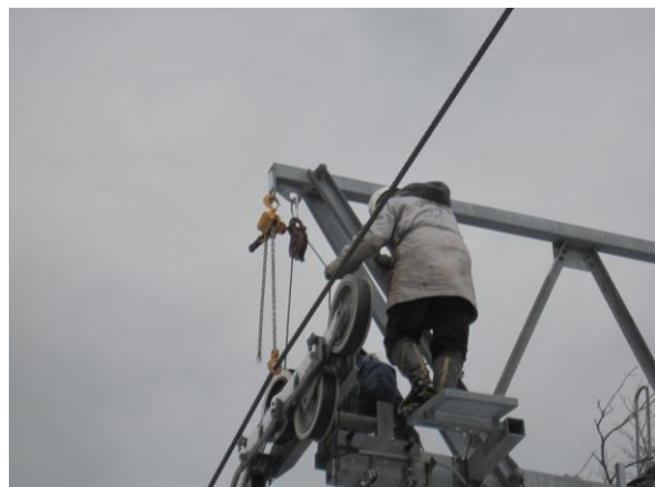
第5ペアリフト索輪交換