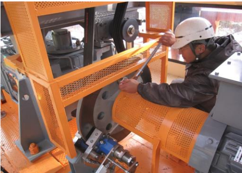
リフト予備原動機による救助訓練