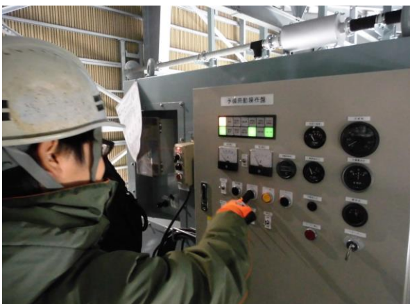
ゴンドラ予備原動機試験