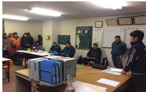
係員への教育訓練