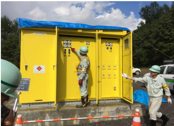
第2ペアリフトキュービクル更新